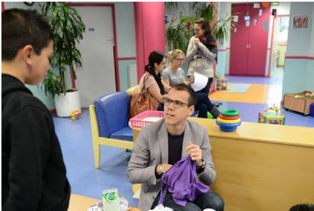
La protection maternelle et infantile