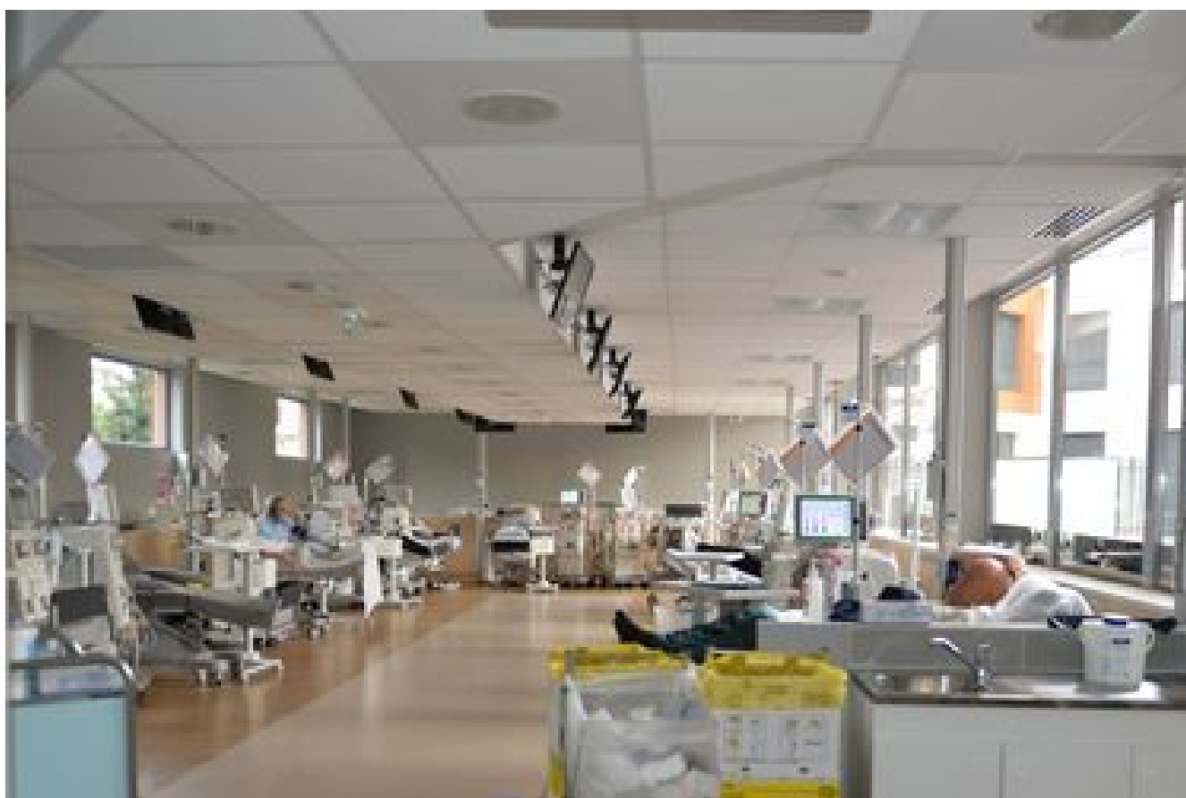
Le centre d'autodialyse Jean Mermoz