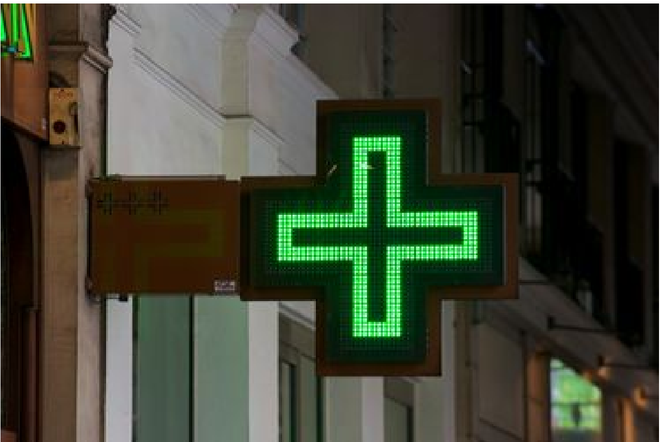
Médecine et pharmacies de garde