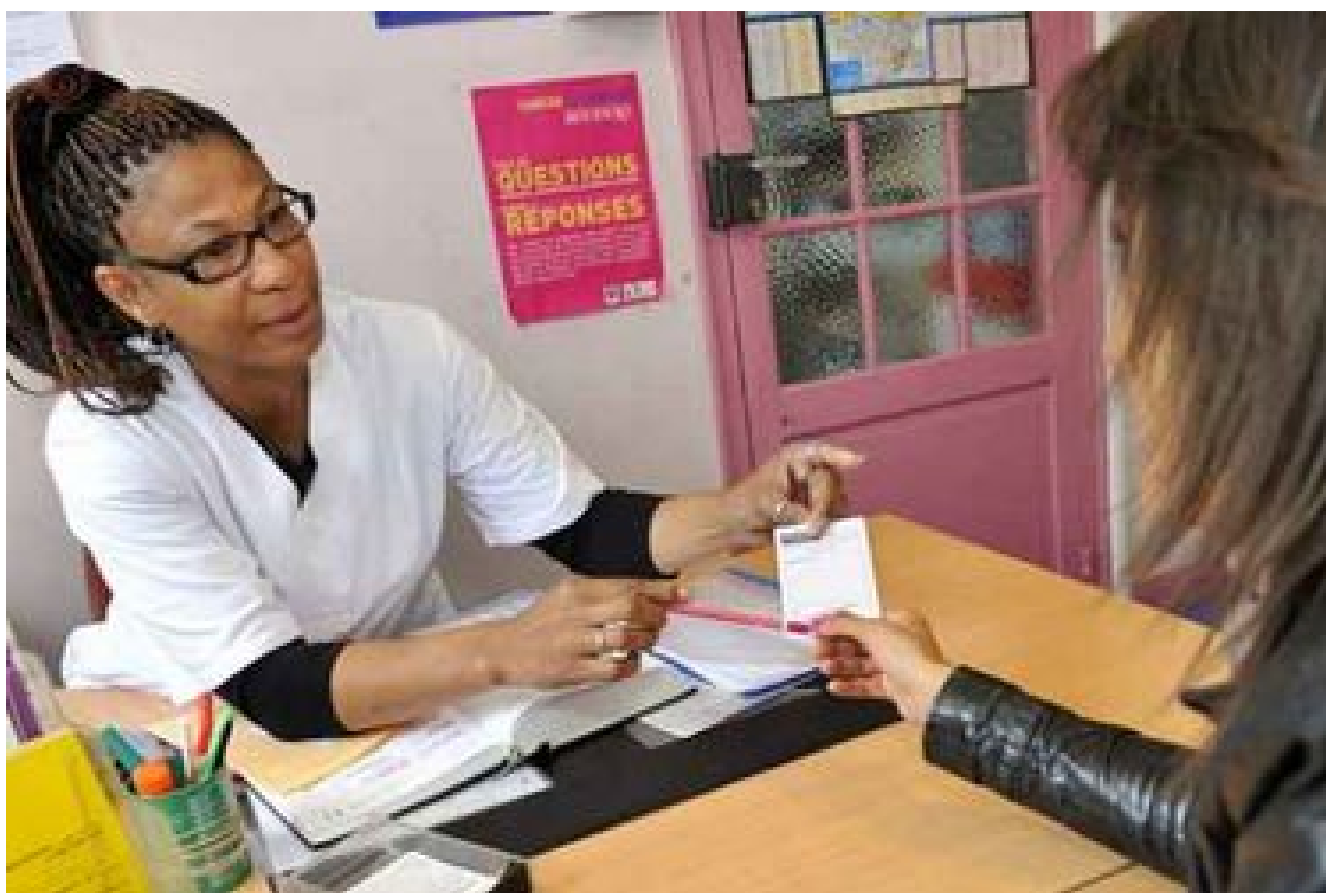
Les structures de prévention santé du département