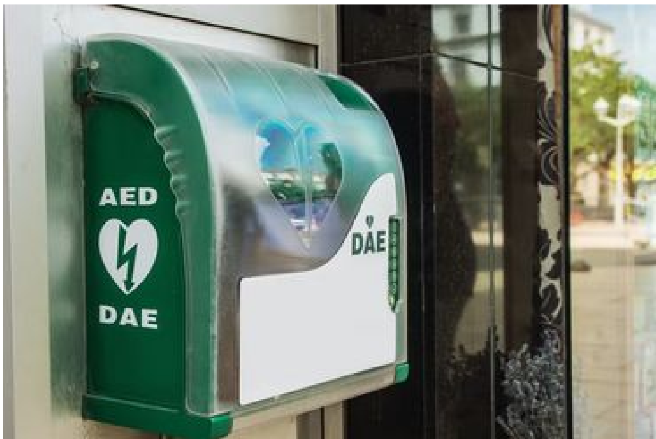
Trouver un défibrillateur