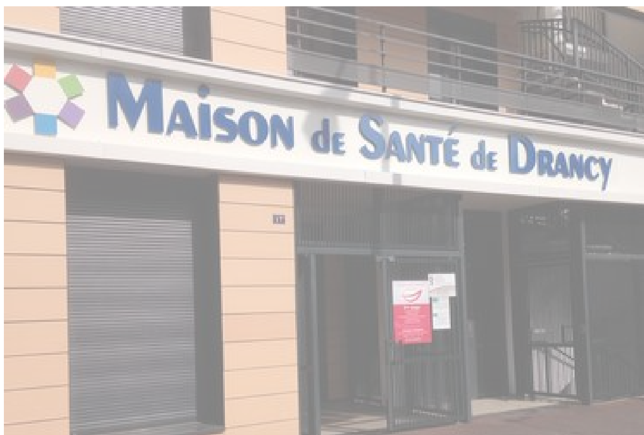
La maison de santé

L'ANNUAIRE DES PROFESSIONNELS DE SANTÉ (AMELI.FR)