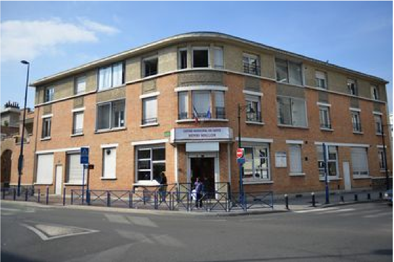
Les centres municipaux de santé