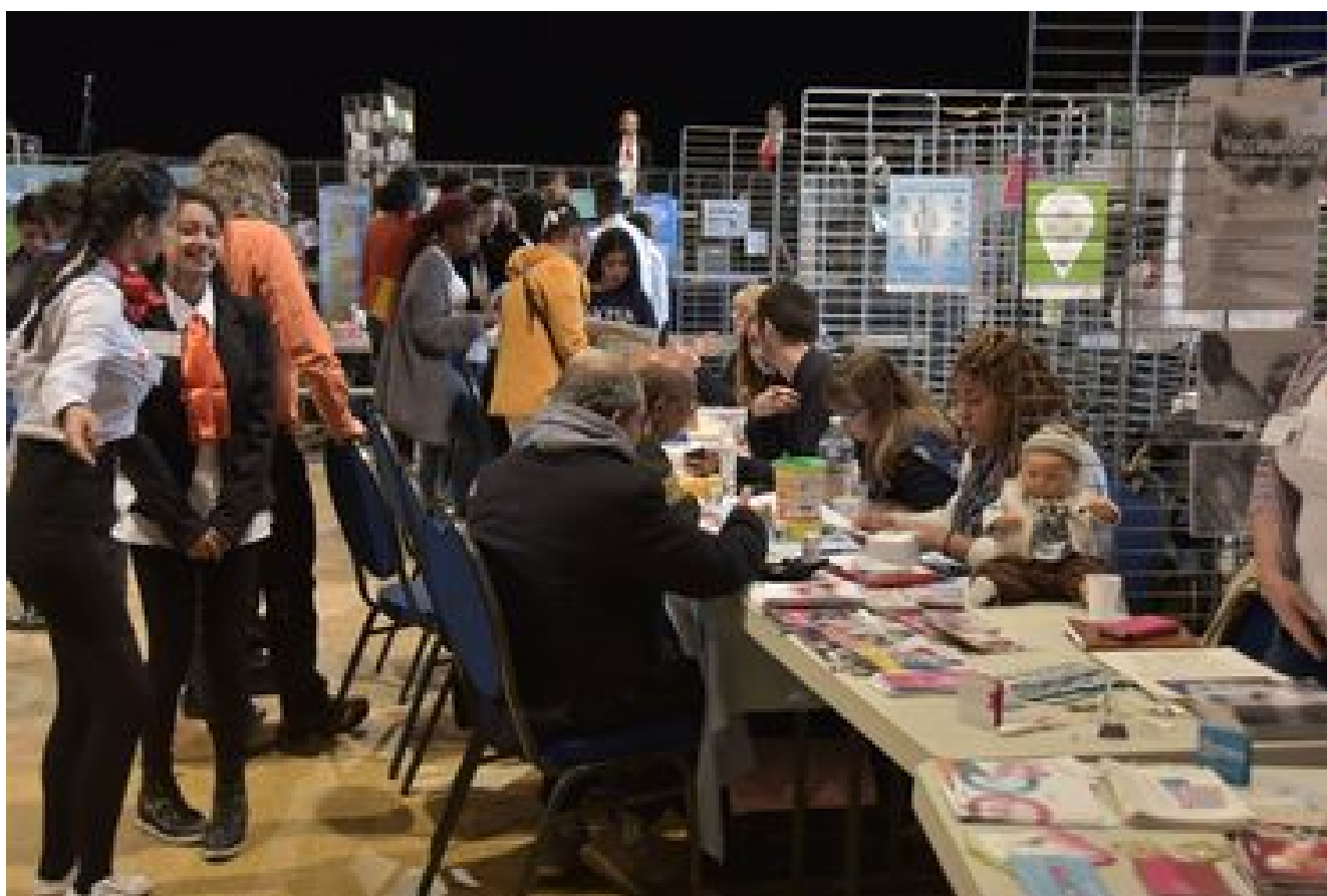
L'Atelier Santé Ville