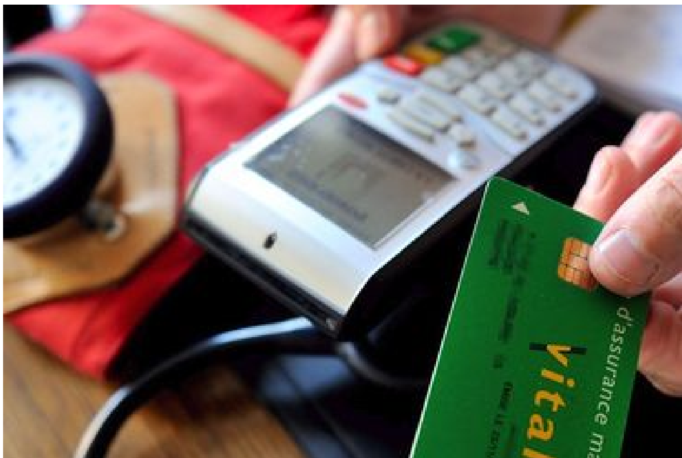
Une complémentaire santé pour tous les Drancéens