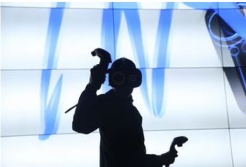
Graff en 3D, Nataniel Halberstam

Decouvrez en détails des œuvres de natures variées (peintures, sculptures, oeuvres musicales ou théâtrales). Les collections du Musée numérique s'enrichissent grâce à la participation de nouveaux établissements culturels à l'échelle régionale, nationales et internationales.