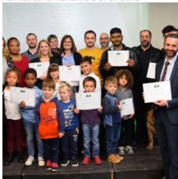
La Ville, ses établissements scolaires, les professeurs et élèves récompensés par l'Éducation nationale