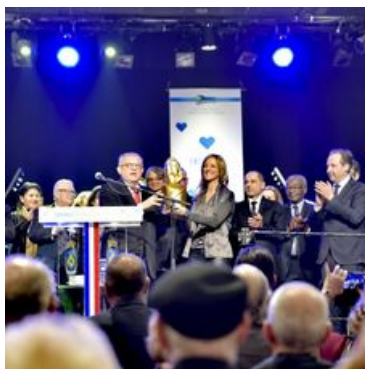
Remise de la Marianne d'Or en 2018

Les nombreuses actions engagées par la Ville répondent toutes à des objectifs sociaux, économiques et écologiques. Elles sont menées pour et aux côtés des Drancéens.