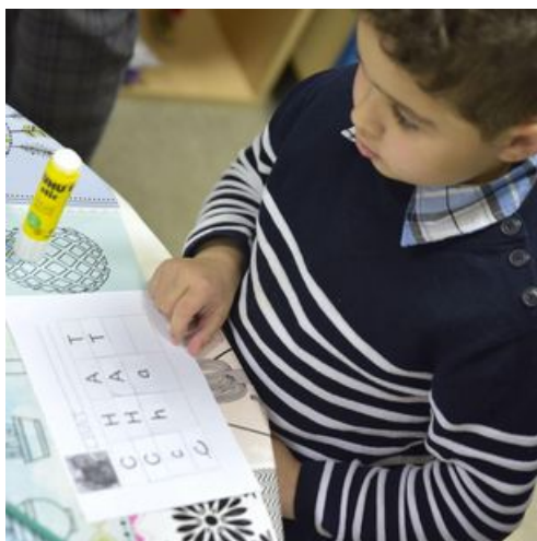
Soutien scolaire gratuit, proposé de la maternelle au CE1. Plus de 400 élèves en bénéficient annuellement.

Pour aider ceux qui font face aux difficultés économiques et sociales, la Municipalité place la réussite au cœur de son action. La commune consacre plus de 25 % de son budget à l'éducation, à l'enfance et à la jeunesse. Un effort important, mais justifié par la sociologie de la ville. 42 % des Drancéens ont moins de 30 ans.