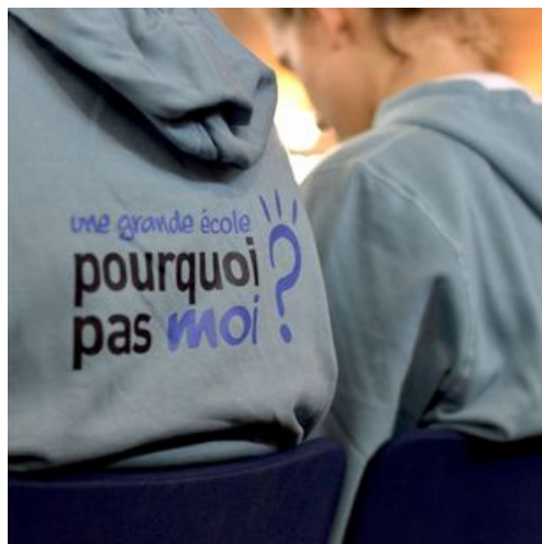
Le programme d'Égalité des chances Drancy/ESSEC concerne chaque année plus de 3000 collégiens et lycéens.