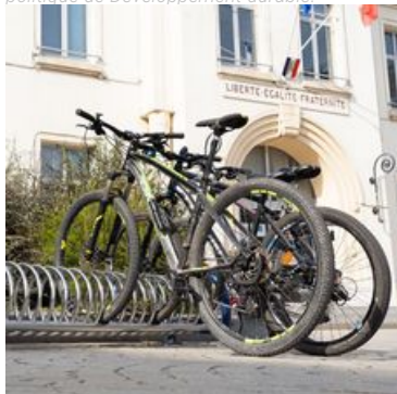
Mobilité durable : après l'électrification de la flotte municipale, la Ville s'engage pour un véritable plan vélo ambitieux.