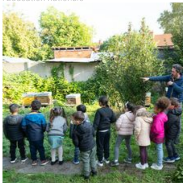
Sensibilisation : les Drancéens, jeunes ou moins jeunes, sont pleinement associés à la politique de Développement durable.