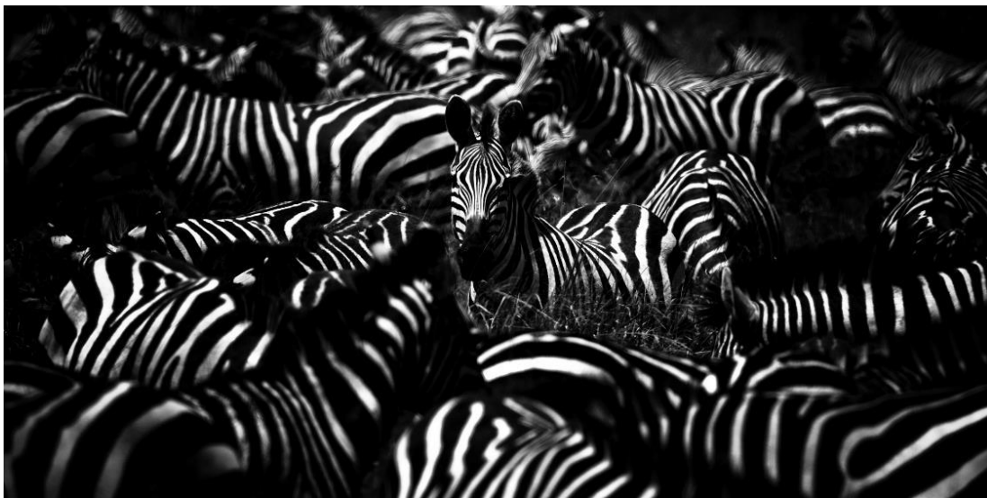
Zèbre seul, Tanzanie, 2007

La photographie animalière a trouvé sa place dans la programmation des équipements culturels drancéens depuis quelques années avec la désormais traditionnelle biennale de photographie animalière Latitudes animales sous la direction artistique du photographe drancéen Tony Crocetta.