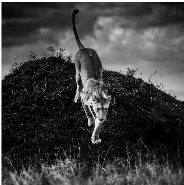
Allure de lionne, Kenya, 2019