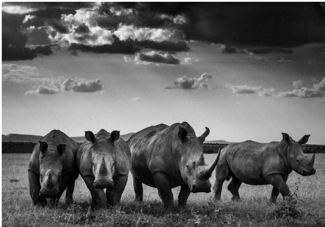
Quatre rhinocéros, Kenya, 2013