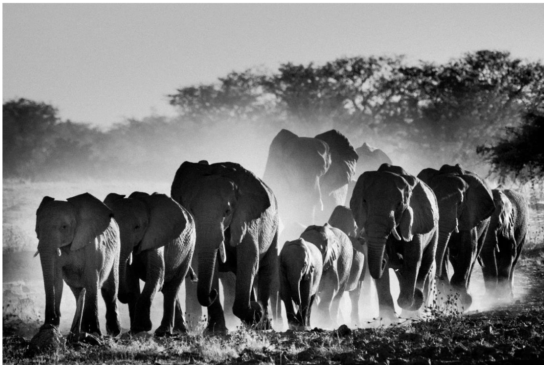
Troupeau d'éléphants, Namibie, 2017