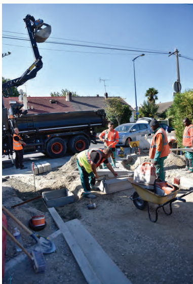
Allée des pivoinés, dans le quartier du Village Parisien, la Ville refait totalement la voirie. Ici, la pose de bordures séparant les trottoirs de la chaussée. Viendra ensuite la pose des nouveaux enrobés. Coût des travaux : 140 000 €.

> dans le quartier de l'Avenir, aux abords du collège Aretha Franklin. On roule désormais en sens unique, rue Jules Grimaud, de la rue Louis Risch vers la rue Védrières et à double sens dans le reste de la rue > dans le quartier Village parisien. • On roule à 30 km/h maximum, rue des Bois de Groslay, à hauteur des rues Robert Manuel et Victor Schoelcher. La limitation de vitesse s'applique sur 20 mètres de part et d'autre des plateaux surélevés qui ont été installés. • Impasse des Limites, le stationnement s'effectue désormais en permanence du côté impair.