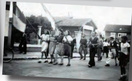
Collection Le Papyrus drancéen