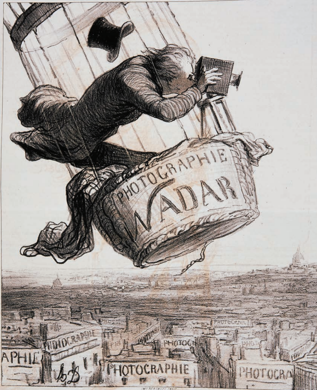
NADAR élevant la Photographie à la hauteur de l'Art

➤ EXPOSITION HONORÉ DAUMIER DU 14 SEPTEMBRE AU 10 NOVEMBRE 2019