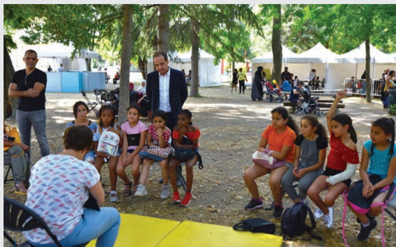
Le député de Drancy, Jean-Christophe Lagarde, devant le stand des médiathèques, lors de la plateforme d'été organisée du 16 au 28 juillet au Parc de Ladoucette.