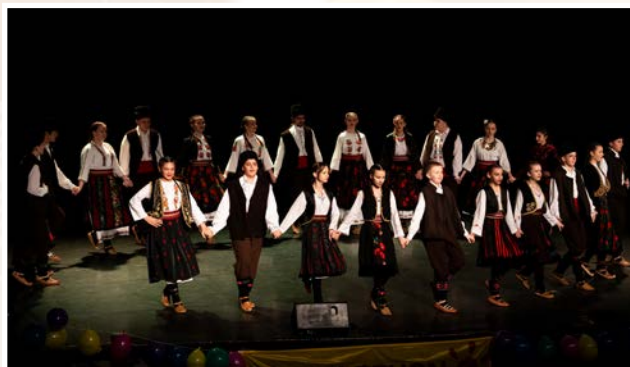
▲ Le mois de solidarité du Téléthon s'est clôturé le 14 décembre par le grand gala des associations. KUD Biseri, Temps Danse, le CBF, entre autres, sont montés sur scène pour la bonne cause.