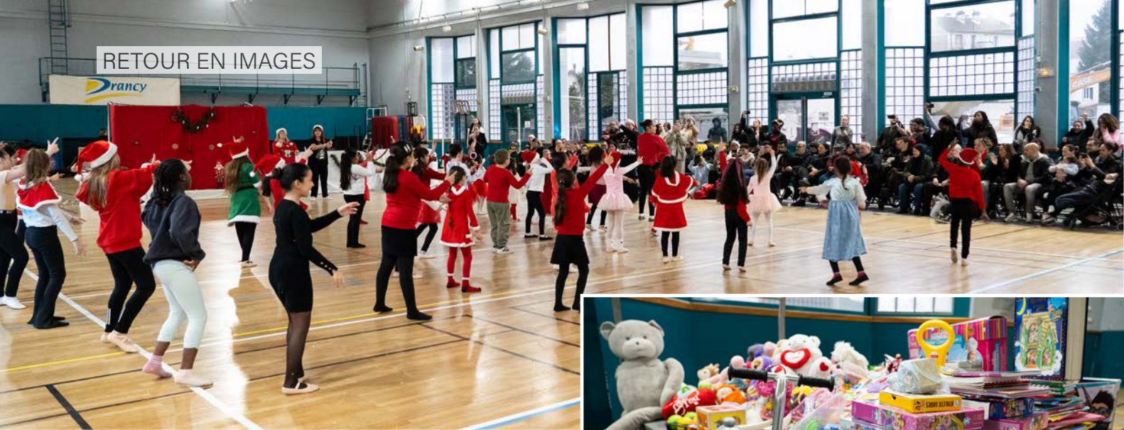
▲► Le Twirling club de Drancy a fait le show lors de son spectacle de fin d'année le 15 décembre. Une collecte de jouets a été organisée en faveur de la Croix-Rouge et l'argent récolté au stand gâteaux a bénéficié au Téléthon.