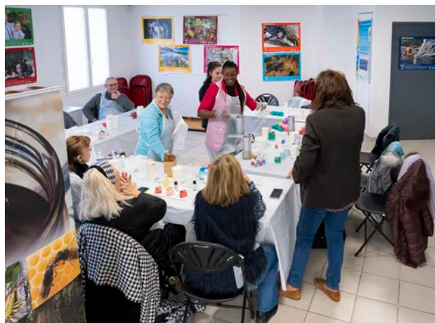
Les ateliers de création de piles artisanales et de bougies ont eu beaucoup de succès. De même que le ciné-débat "Il était une forêt", avec des enfants.

La MGP vient cependant d'annoncer qu'en 2025, année pédagogique, elle fournira une passe ZFE de 24 jours par an.