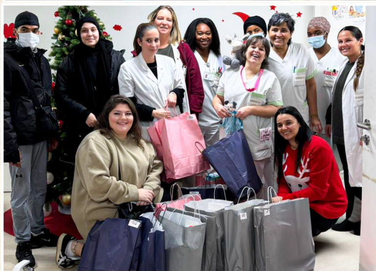
▲ Cette année encore, l'association Main dans la Main s'est rendue dans deux hôpitaux, André Grégoire à Montreuil et Robert Ballanger à Villepinte, pour distribuer les jouets donnés par les Drancéens les 23 et 24 novembre. Les sourires des enfants témoignent du bel élan de solidarité initié par l'association.