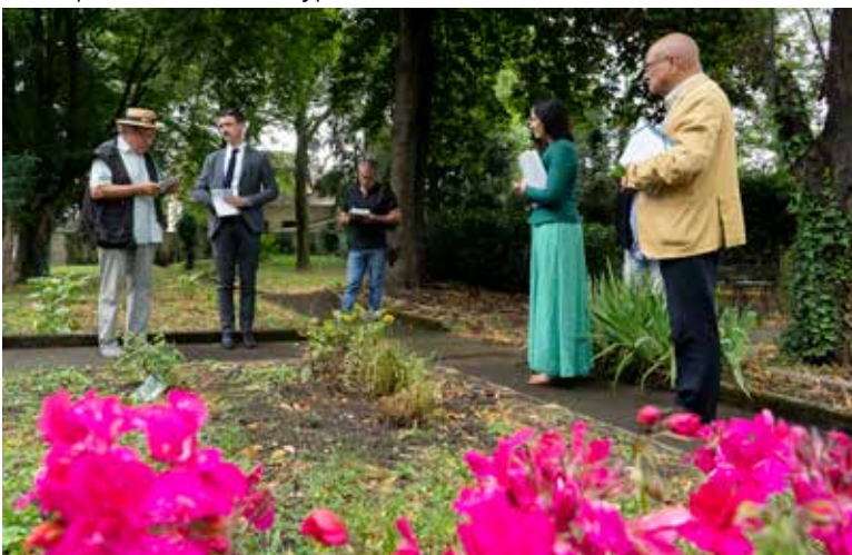
▲ Vendredi 12 juillet, le jury du concours des Villes et villages fleuris visite Drancy à la poursuite de sa 4 e fleur.