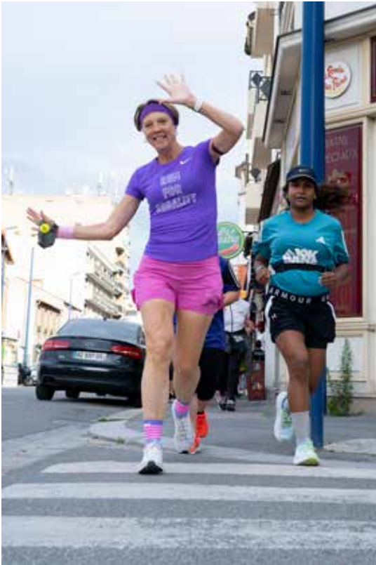
◀ La vague violette a bien eu lieu ! Plus de 100 joggers ont participé à la première édition de la Sine Qua Non Squad, le 16 juillet dernier. Un franc succès pour cette course pour l'égalité, pour le droit des femmes à courir partout où elles le souhaitent et dans la tenue de leur choix. Rendez-vous pour la prochaine course le mardi 13 août.