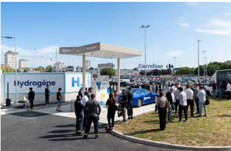
▲ Jeudi 11 juillet était inauguré une des rares pompes à hydrogène au centre commercial Avenir, quelques semaines après le vote de la région Île-de-France la mise en place d'une subvention municipale de 3000 euros pour l'achat de ce type de véhicule.