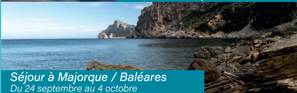
Séjour à Majorque / Baléares Du 24 septembre au 4 octobre