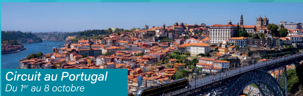
Circuit au Portugal Du 1 er au 8 octobre