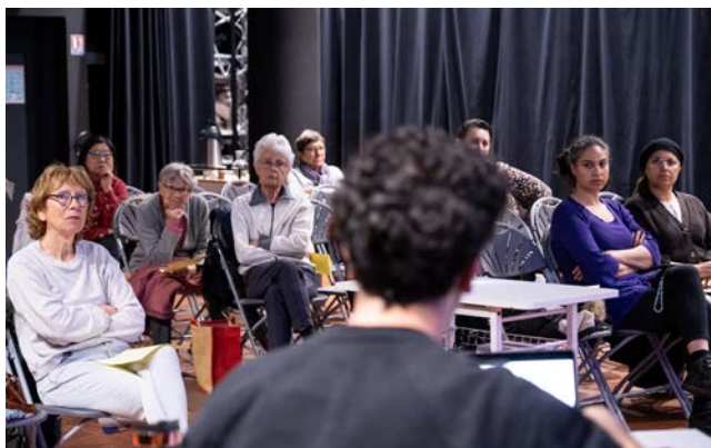
▲ La culture et l'histoire japonaises étaient à l'honneur, samedi 4 mai, à la médiathèque Georges Brassens, pour un petit-déjeuner aux couleurs du pays du Soleil levant.