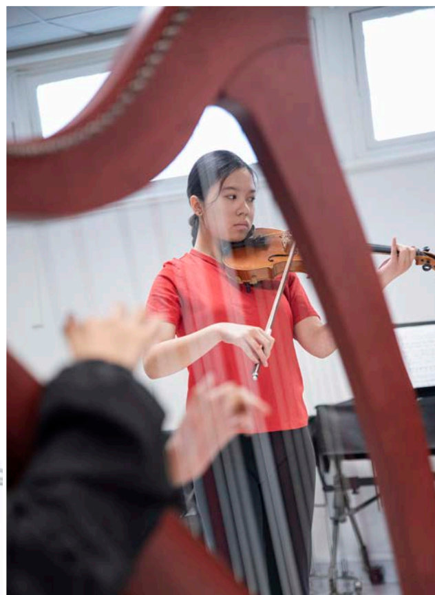
▲ Samedi 4 mai, les portes du Conservatoire étaient grandes ouvertes pour accueillir les Drancéens, ceux qui y suivent déjà des cours, mais aussi ceux qui ont la fibre artistique prête à s'exprimer.