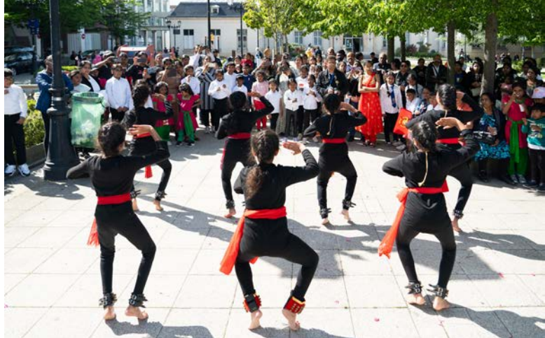
▲ Mercredi 15 mai, sur la place de l'Hôtel de Ville, les Tamouls du Sri Lanka commémoraient le jour du Souvenir de Mullivaikkal. Entre 80 000 et 100 000 victimes ont péri durant cette guerre civile meurtrière qualifiée de génocide.