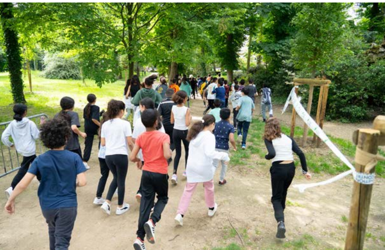
▲ En partenariat avec le collège Paul Bert, les lycées de Drancy, l'association La course contre la faim et l'Amicale Sportive des Coureurs de Drancy, 500 jeunes drancéens ont couru au parc contre la faim, vendredi 17 mai.