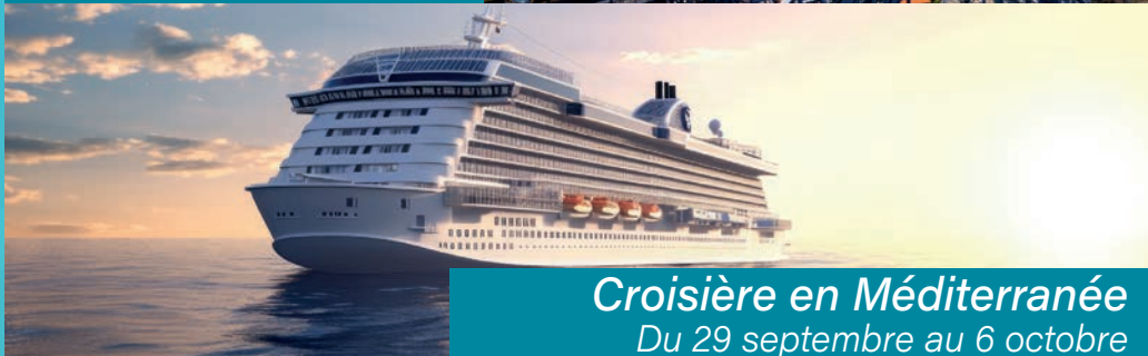
Croisière en Méditerranée Du 29 septembre au 6 octobre