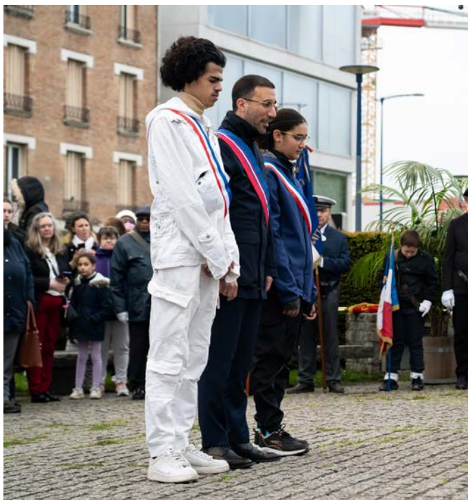
▲ Mercredi 8 mai, on célèbre à Drancy comme partout en France la victoire de 1945. Ses héros disparaissent lentement, mais leur bravoure reste dans nos cœurs.