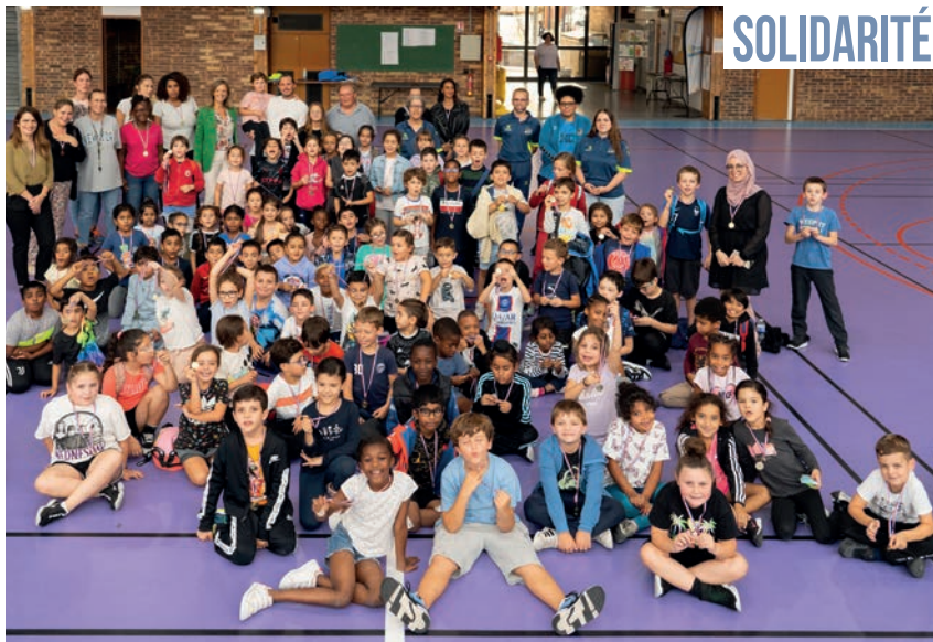
◀ La ville a accueilli la 3 e édition de la Giulia's cup, organisée par Drancy futsal pour soutenir la recherche sur les cancers pédiatriques. Le gymnase Joliot-Curie a fait le plein.