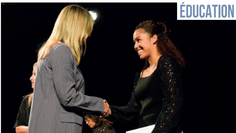
▲ Les 230 jeunes diplômés ayant réussi leur bac avec mention avaient rendez-vous à l'Espace culturel, jeudi 28 septembre, pour recevoir leur carte-cadeau offerte par la ville.