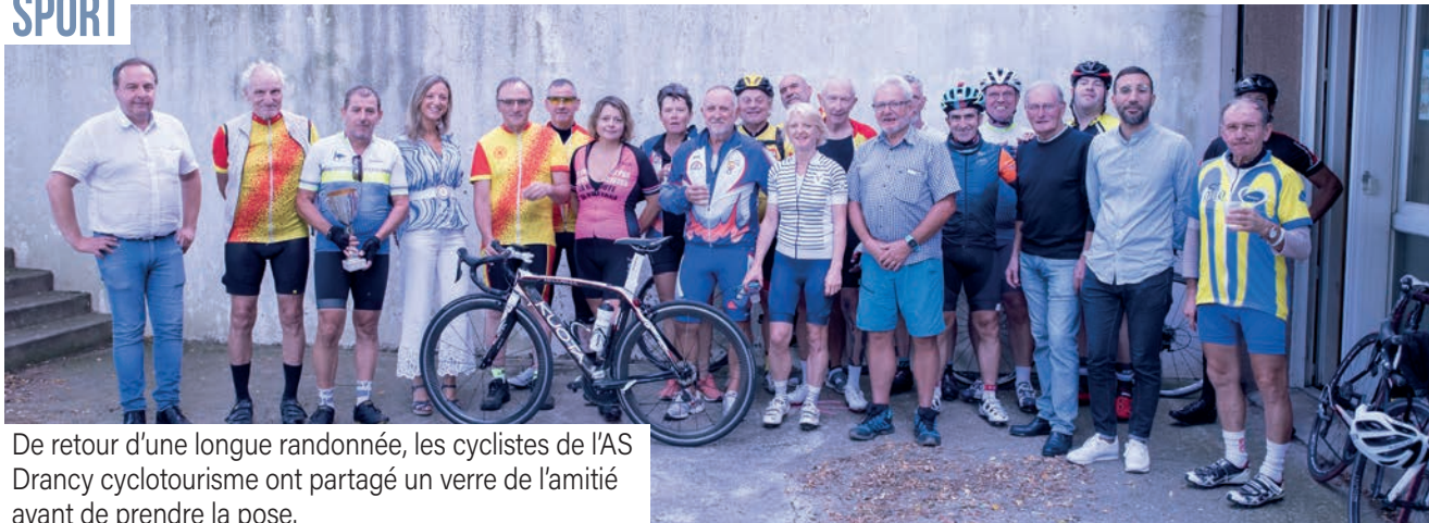
De retour d'une longue randonnée, les cyclistes de l'AS Drancy cyclotourisme ont partagé un verre de l'amitié avant de prendre la pose.