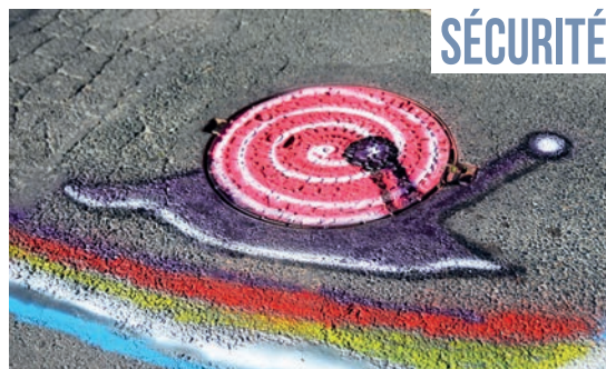
▲ À l'initiative du conseil de quartier du Petit Drancy et de l'association BBN, la rue Voltaire a été embellie. Les œuvres inviteront les automobilistes à lever le pied devant la sortie de l'école Salengro-Voltaire.