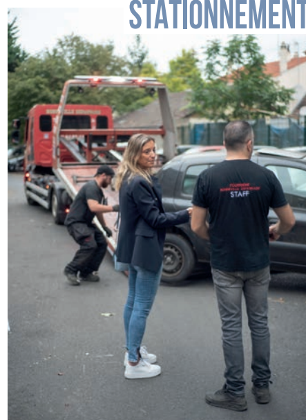
▲ Mardi 3 octobre, la Police municipale a mis en fourrière les épaves de la rue de Budapest qui empêchaient les résidents de se garer au quotidien.