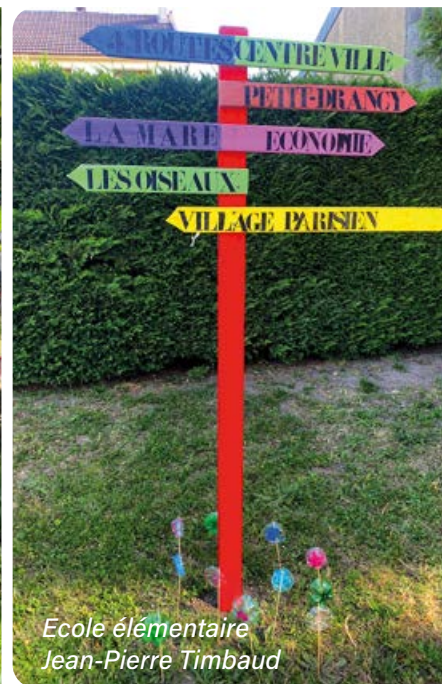
École élémentaire Jean-Pierre Timbaud