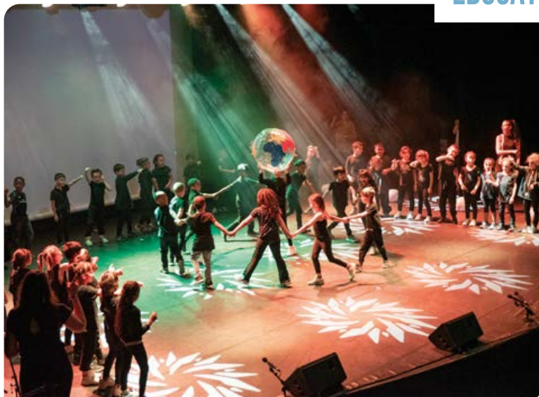
Lundi 13 juin , spectacle de fin d'année de l'école Cristino Garcia, à l'Espace culturel du parc.