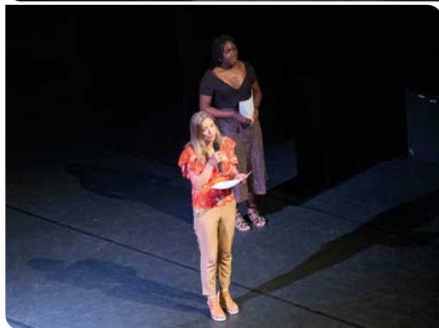
Vendredi 17 juin , remise de diplômes aux jeunes engagés dans le programme d'égalité des chances proposé par la Ville et l'ESSEC.