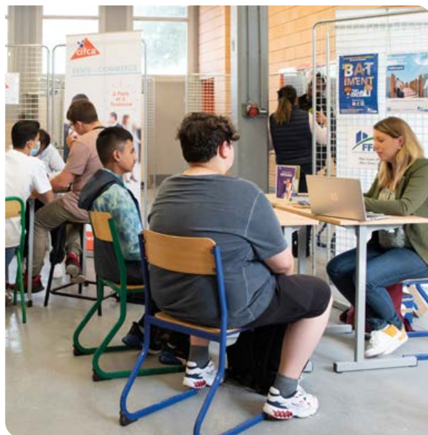
Mardi 21 juin , le collège Jorissen organisait un forum de l'Alternance. L'occasion pour les élèves de découvrir les formations proposées par les CFA locaux et les opportunités professionnelles à la clé.