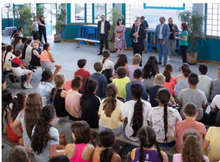
Jedi 16 juin , plus de 1000 élèves de CM2 étaient réunis au gymnase Auguste Delaune pour recevoir leur permis Internet, gage de leur capacité à naviguer en toute sécurité.