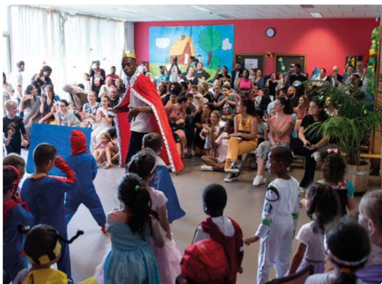
Mercredi 15 juin , fête de fin d'année de l'école Jean Monnet.