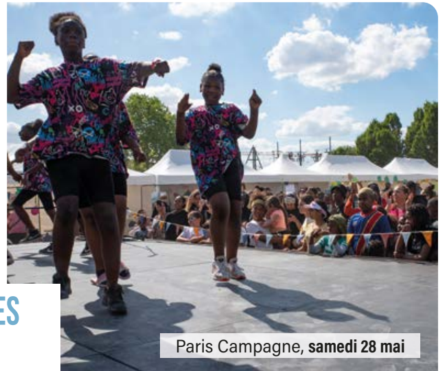
Paris Campagne, samedi 28 mai