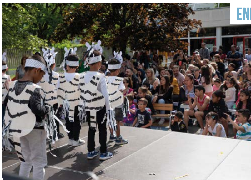
Samedi 21 mai, kermesse de l'école maternelle France Bloch.