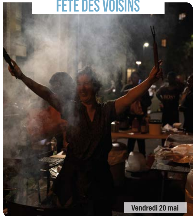
Vendredi 20 mai