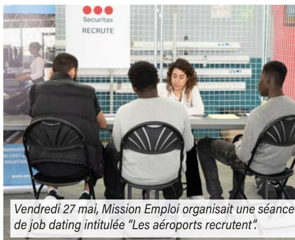
Vendredi 27 mai, Mission Emploi organisait une séance de job dating intitulée "Les aéroports recrutent".

Le métier a beaucoup changé ces dernières années avec désormais