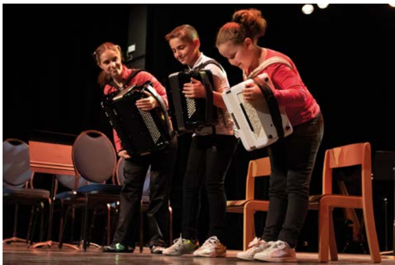
Mardi 31 mai , concert des classes à horaires aménagés musique (CHAM) à l'Espace culturel du parc.