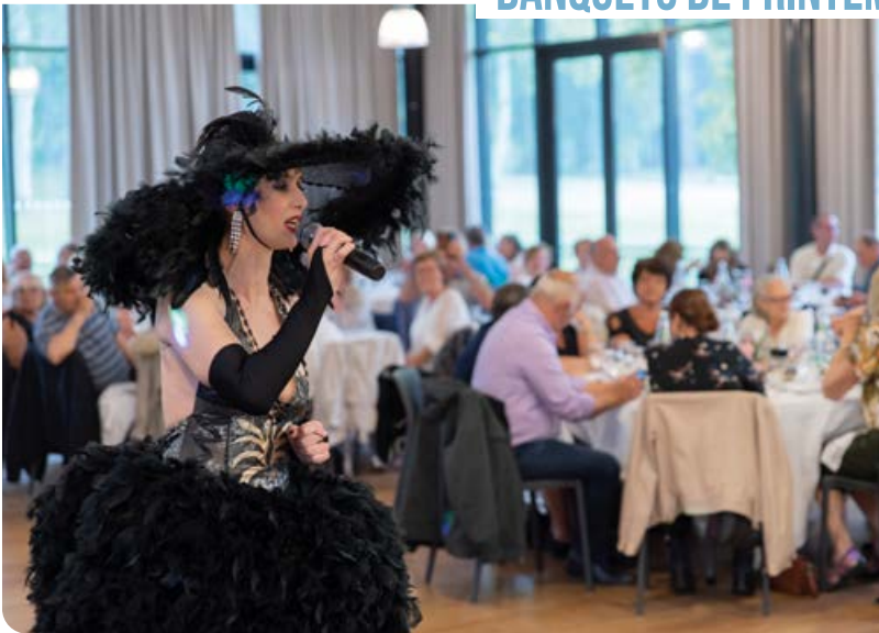
Pour les retraités, entre le lundi 23 mai et le jeudi 9 juin.