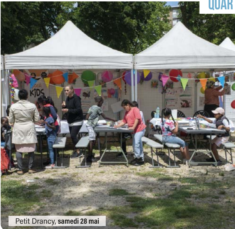
Petit Drancy, samedi 28 mai