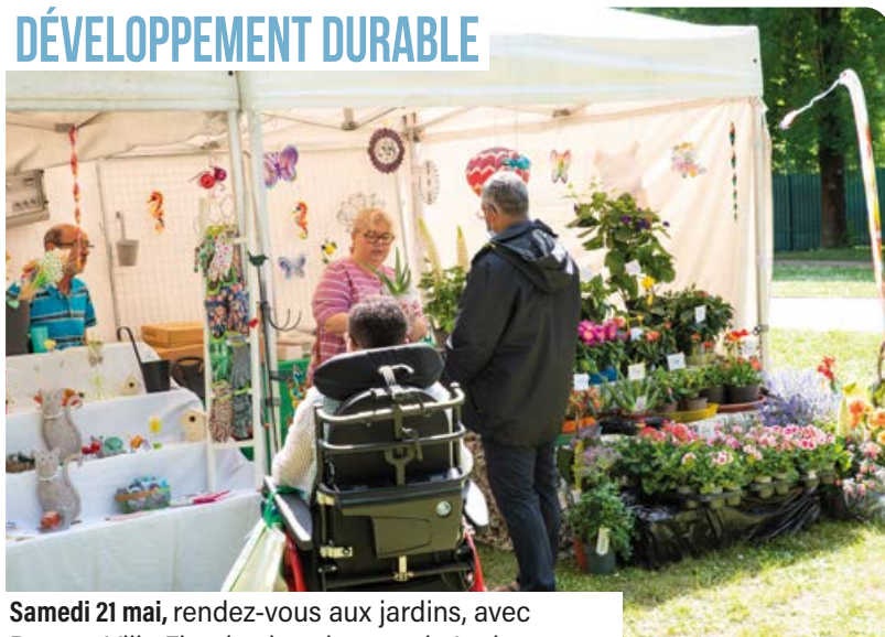
Samedi 21 mai, rendez-vous aux jardins, avec Drancy Ville Fleurie, dans le parc de Ladoucette.

Samedi 21 mai, clôture de la semaine de l'Intégrathlon pendant laquelle handicapés et valides, sportifs ou non, se sont rassemblés sur les terrains de sport.