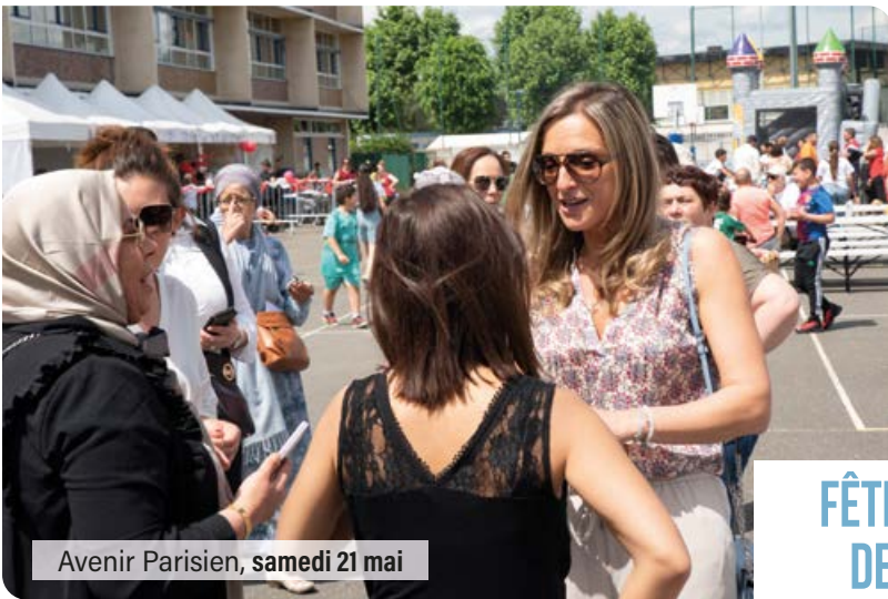
Avenir Parisien, samedi 21 mai