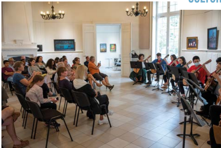
Dimanche 22 mai , concert des élèves guitaristes du conservatoire au château de Ladoucette.