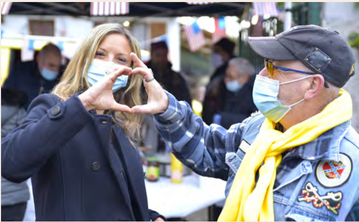
Samedi 5 décembre, les Confédérate ont innové avec le seul drive "Téléthon" du département. Au menu : leur célèbre bœuf bourguignon et des crêpes.