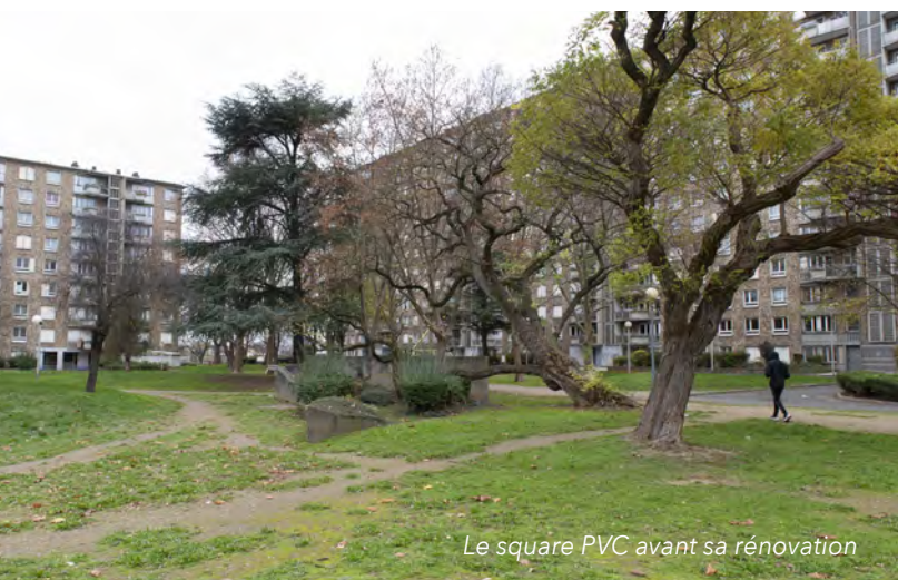
Le square PVC avant sa rénovation