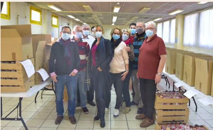
Les bénévoles ont préparé 9370 goûters qui ont ensuite été vendus dans toutes les écoles maternelles et élémentaires.