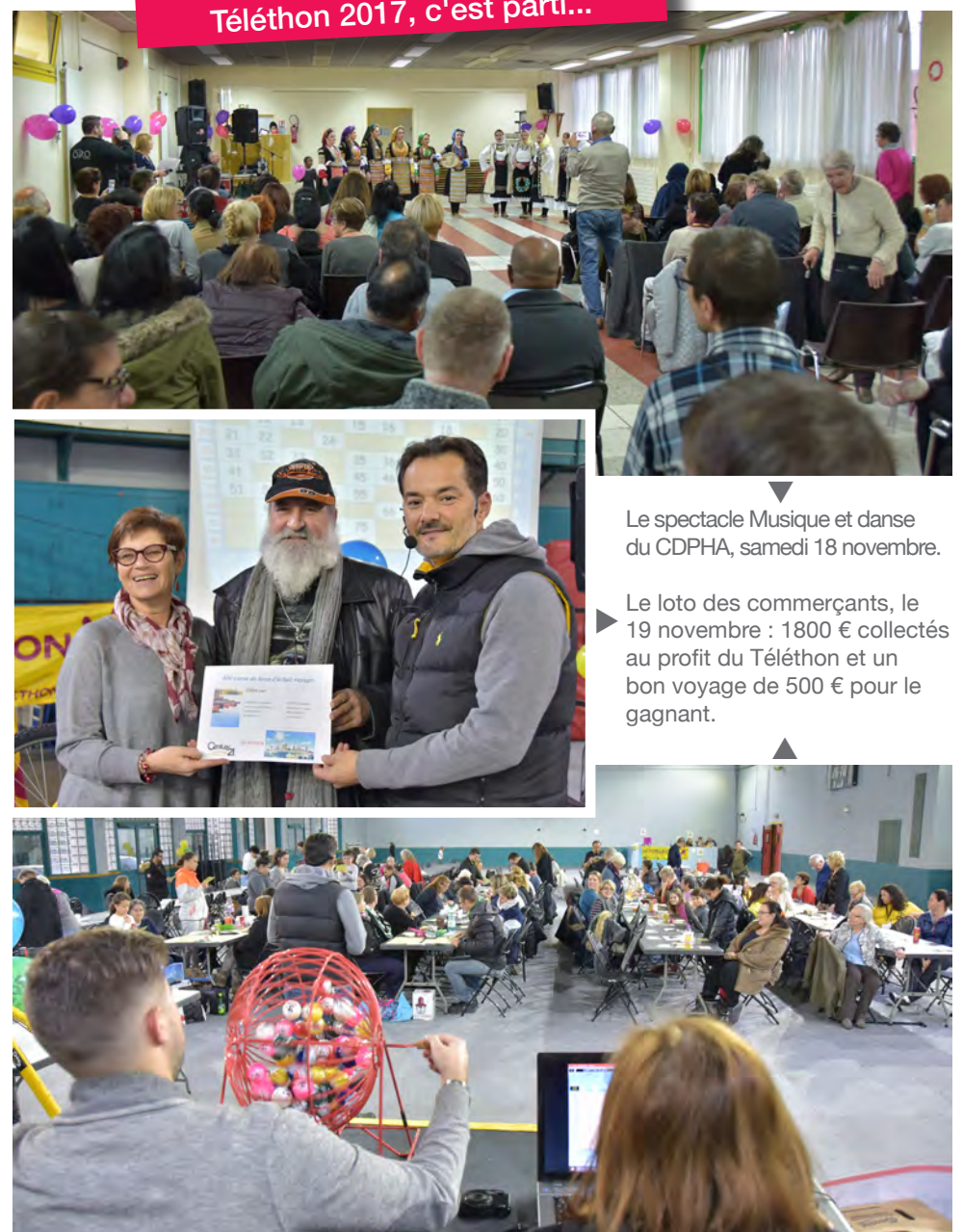
Téléthon 2017, c'est parti...

En 2017, mobilisons-nous encore davantage afin de gagner toujours plus pour la recherche. Pour cela, plusieurs solutions : faire un don et/ou participer aux différentes manifestations organisées ces prochains jours à Drancy.