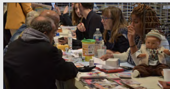
Forum santé 2017