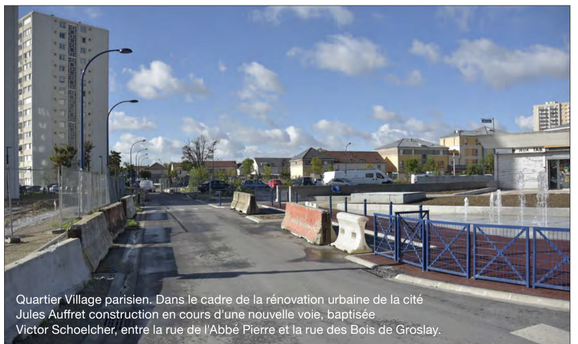
Quartier Village parisien. Dans le cadre de la rénovation urbaine de la cité Jules Auffret construction en cours d'une nouvelle voie, baptisée Victor Schoelcher, entre la rue de l'Abbé Pierre et la rue des Bois de Grosly.