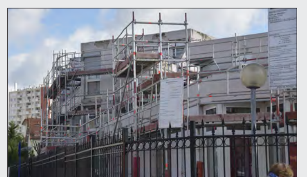
Résidence Les Myosotis. Les travaux sur les façades sont en cours.