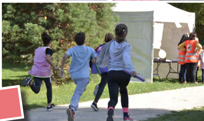
Jeudi 21 septembre, au parc de Ladoucette, des élèves de Saint-Germain, écoliers, collégiens et lycéens ont participé à la course du cœur en présence notamment du service municipal de la Jeunesse et de la Croix-Rouge.