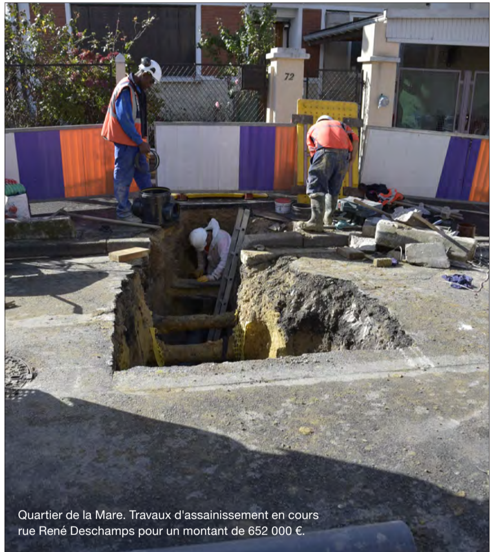
Quartier de la Mare. Travaux d'assainissement en cours rue René Deschamps pour un montant de 652 000 €.