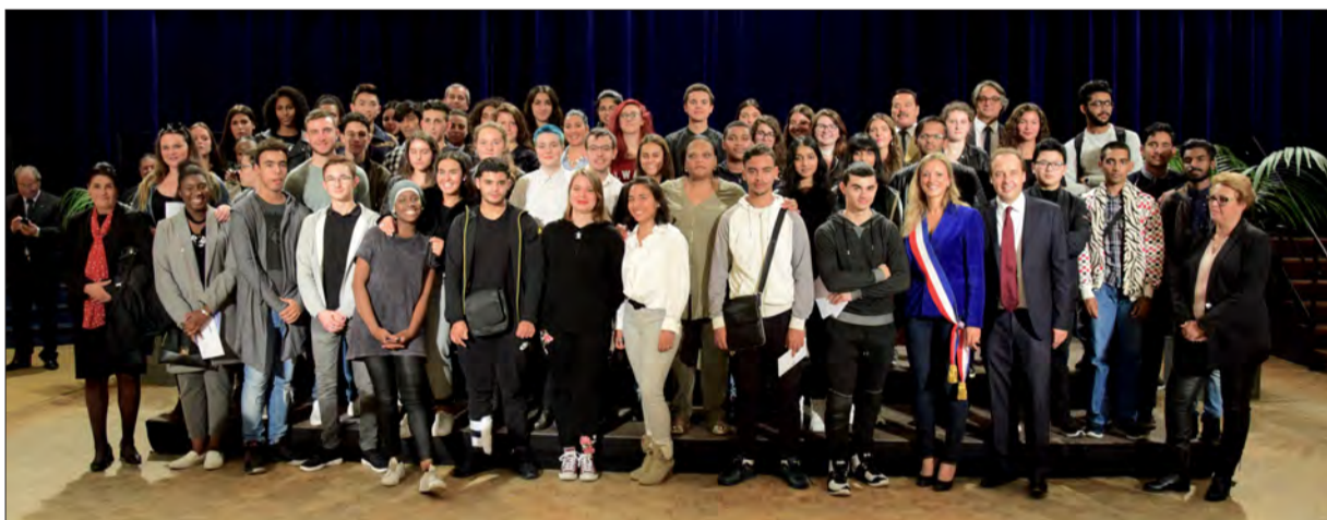
Lundi 2 octobre, Espace culturel du parc. Près de 200 bacheliers avec mention ont été récompensés par la Ville pour leur travail et leur réussite. Selon la mention obtenue, ils ont reçu des cartes cadeaux d'une valeur de 50 à 150 €.