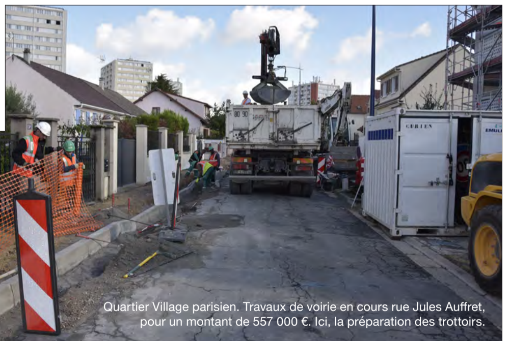
Quartier Village parisien. Travaux de voirie en cours rue Jules Auffret, pour un montant de 557 000 €. Ici, la préparation des trottoirs.