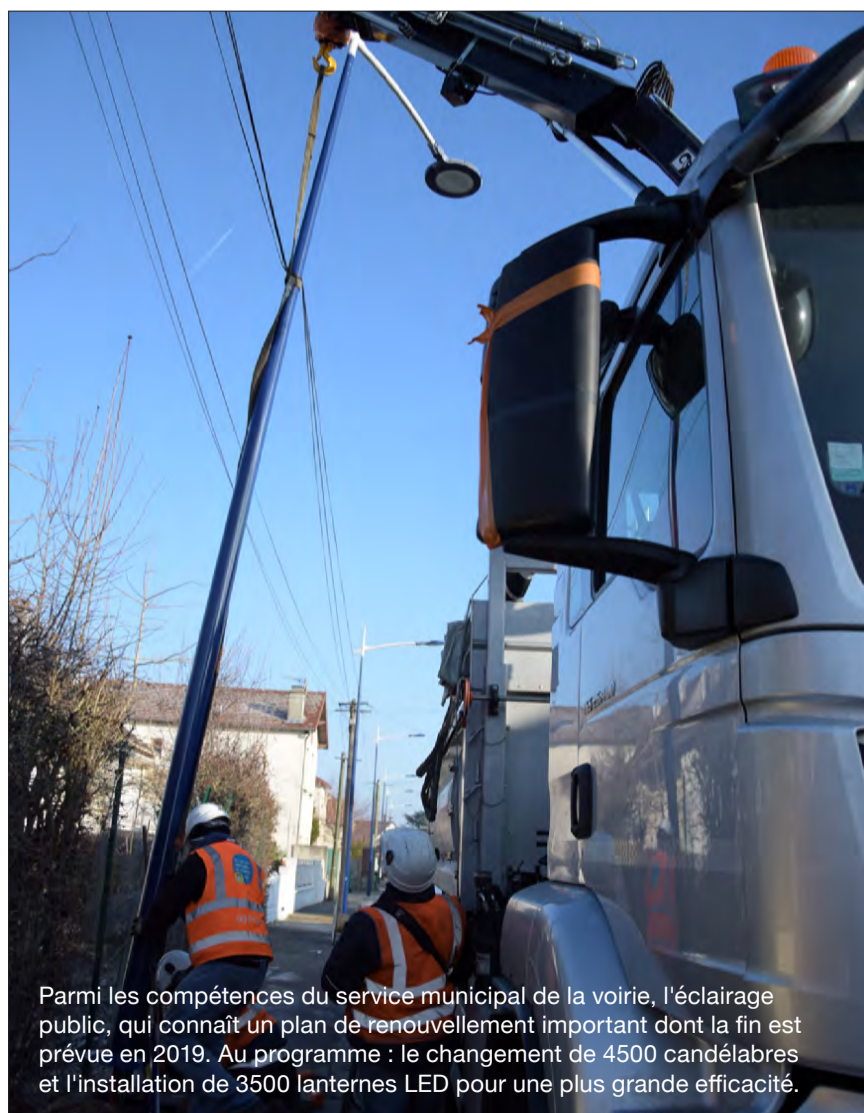
Parmi les compétences du service municipal de la voirie, l'éclairage public, qui connaît un plan de renouvellement important dont la fin est prévue en 2019. Au programme : le changement de 4500 candélabres et l'installation de 3500 lanternes LED pour une plus grande efficacité.