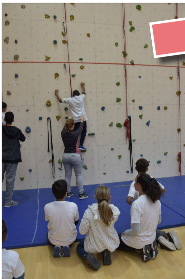
Mercredi 27 septembre, journée du sport dans les collèges drancéens. Ici, au collège Paul Bert. L'objectif : promouvoir l'exercice physique et le sport à tous les niveaux et pour tous les publics.