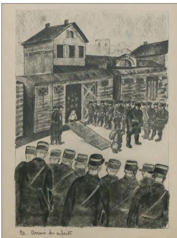
"Première arrivée des enfants en gare du Bourget-Drancy, sans parents ni secours".

plus tard, il sera libéré du camp de Drancy. Interné sur dénonciation le 12 juillet 1942, ce Russe – naturalisé Français suite à sa participation à la Grande guerre dans la Légion étrangère, s'exprimait avec ses crayons. Devant les insupportables conditions d'internement au camp, devant l'horreur des convois qui partent régulièrement, depuis le 22 mars 1942, vers Auschwitz, mais aussi devant les rares instants de répit et de solidarité parmi les détenus, il va dessiner. À tout prix. Car peindre, c'est dire.