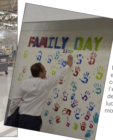
Samedi 23 septembre, Family Day chez ELM Leblanc. L'occasion pour les enfants des collaborateurs de l'entreprise drancéenne, de découvrir, de façon ludique et pédagogique le monde de l'entreprise.