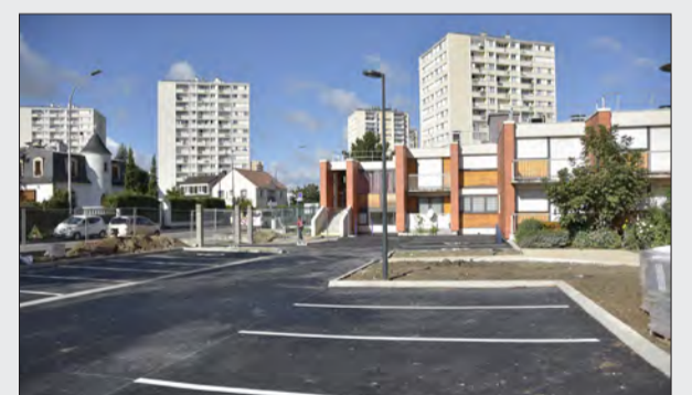
Résidence des Mimosas. Le parking est en cours d'agrandissement. Un muret et une clôture sont en train d'être posés autour du bâtiment et des espaces extérieurs afin de résidentialiser la structure.

C'est lorsque ce chantier sera achevé que débuteront les travaux intérieurs dans les deux autres résidences, aux Lilas, puis aux Mimosas.