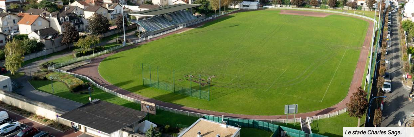
Le stade Charles Sage.