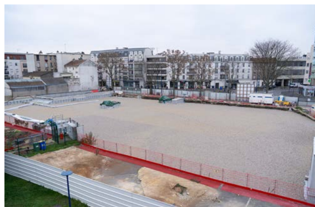
Le parking souterrain de 230 places du stade nautique est terminé.

flambant neuf, doté de services publics et ouvert sur la ville. Enfin, dans le quartier du Baillet, c'est le top départ. Dans les semaines qui viennent, la construction des bâtiments de la partie située à l'ouest de la rue Eugène Pottier débutera. C'est ici que l'on trouvera des surfaces commerciales ainsi que des logements. Mais c'est surtout là que se situera le nouvel Espace culturel dont la première pierre est annoncée pour très bientôt.