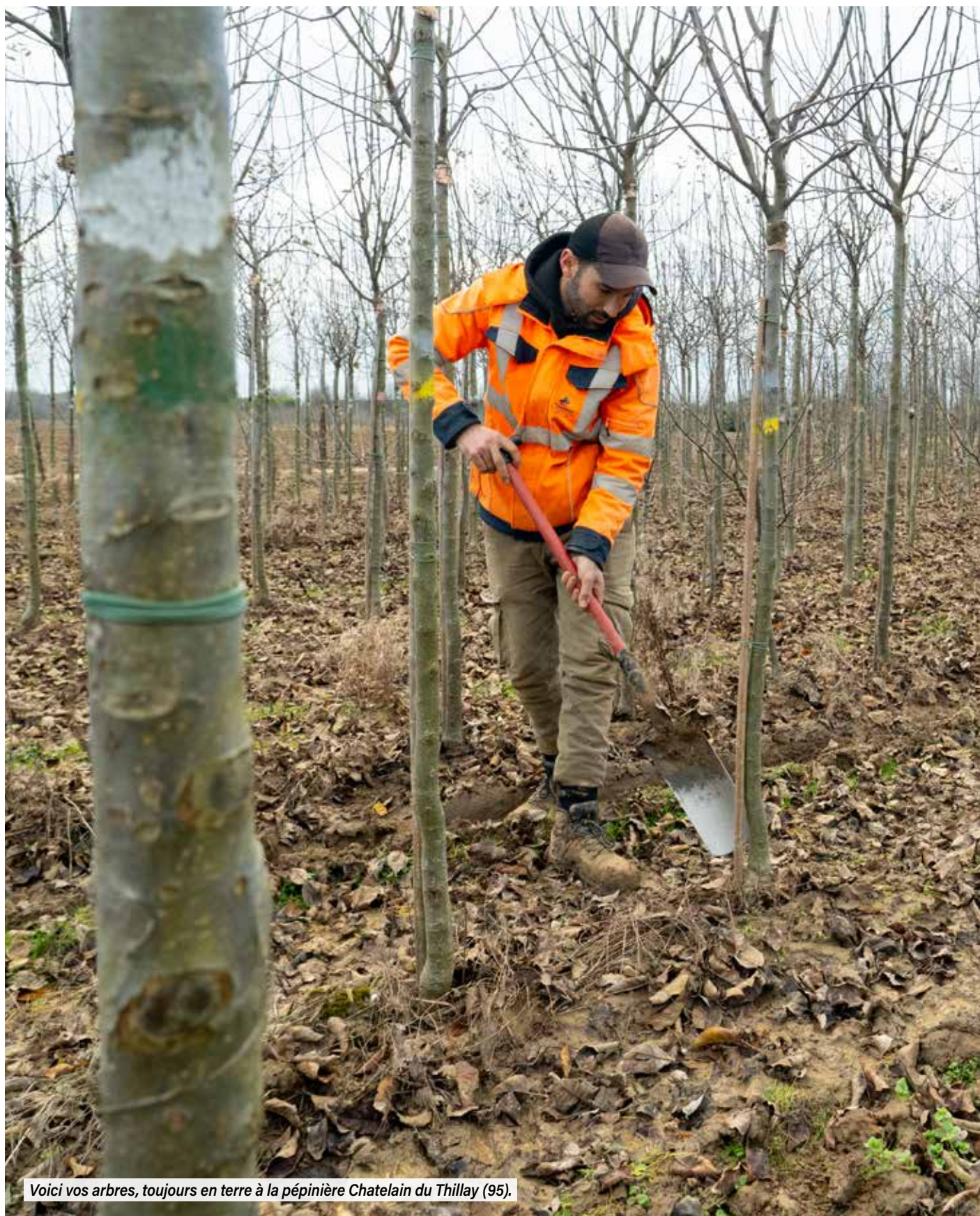
Voici vos arbres, toujours en terre à la pépinière Chatelain du Thillay (95).